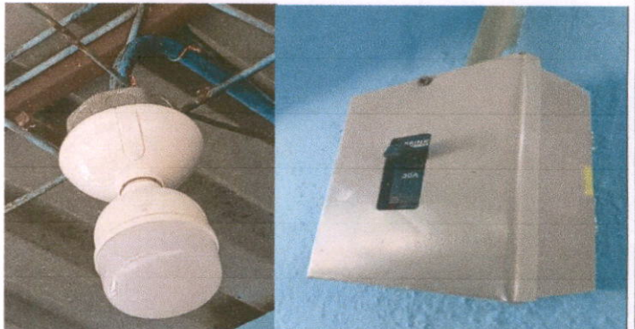
Foto 6: Sustitución de focos ahorradores, plafoneras y flipones en el establecimiento.

Observación: Si es necesario se pueden agregar hojas adicionales y actualizar el número de hojas.