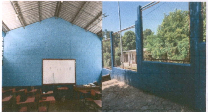
Foto 4: Pintura en muros exteriores e interiores en el establecimiento.