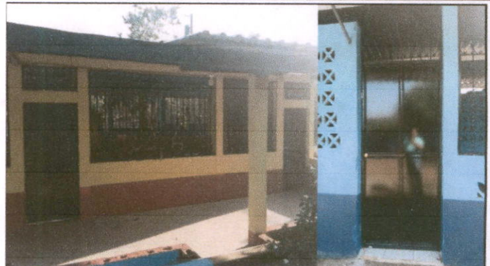
Foto 2: Sustitución de puertas de madera por metal, en modulo 4 y cocina.